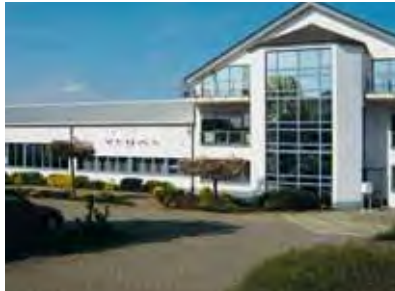
VEGA STRADE LDA | DEUTSCHLAND