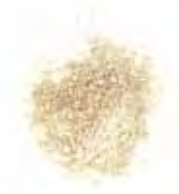
KLEUR 2 | WIT | MAT