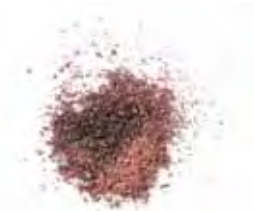
FARBE 6 | AUBERGINE