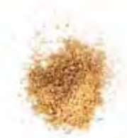
KLEUR 3 | OKER GEEL | GLANS