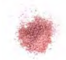
FARBE 9 | DONKER ROZE