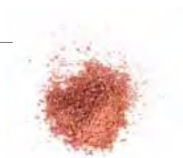
KLEUR 4 | LICHT TERRACOTTA