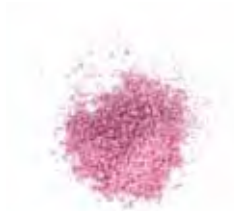
FARBE 8 | LICHT ROZE