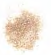
KLEUR 5 | CREME | MAT