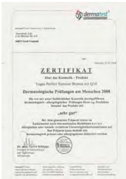
Bovenstaand een voorbeeld van één van de Certificaten die aan de "Vegas" producten gegeven zijn