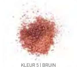
KLEUR 5 | BRUIN