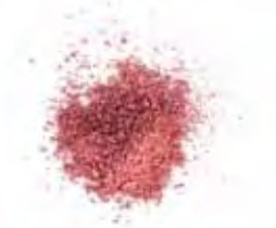
FARBE 7 | PASTEL