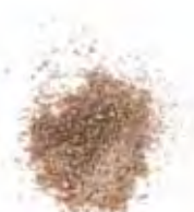
KLEUR 4 | HAZELNOOT | MAT