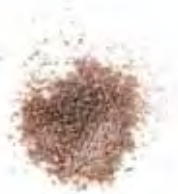
KLEUR 6 | CHOCOLADE | GLANS