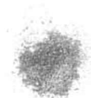
KLEUR 1 | ZILVER | GLANS